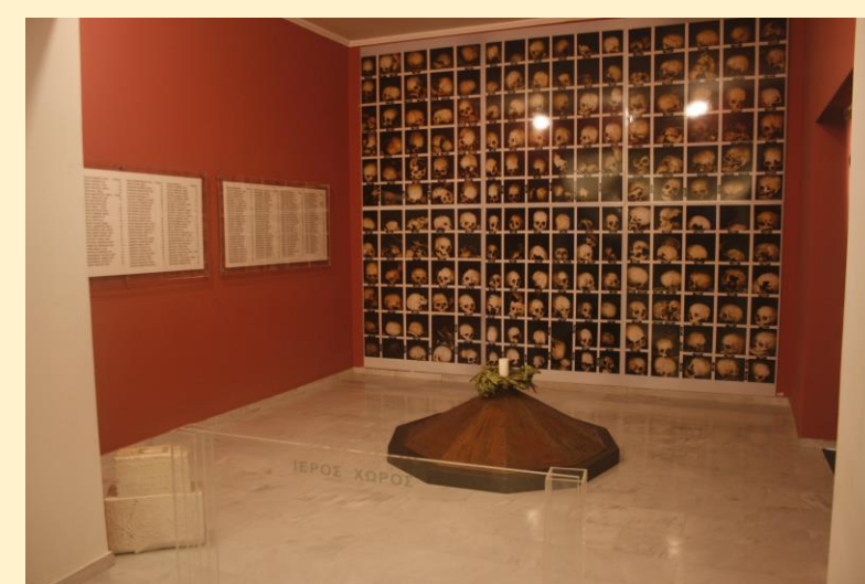
Το μουσείο Ναζισμού