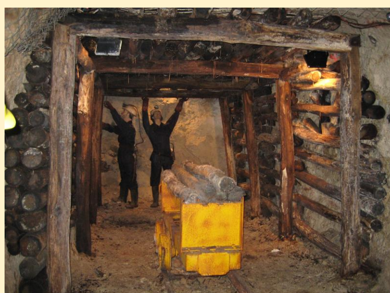
Μέσα στο ορυχείο «βεγονέτο»