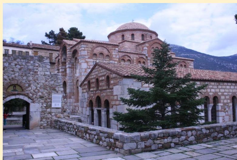
Η μονή Οσίου Λουκά