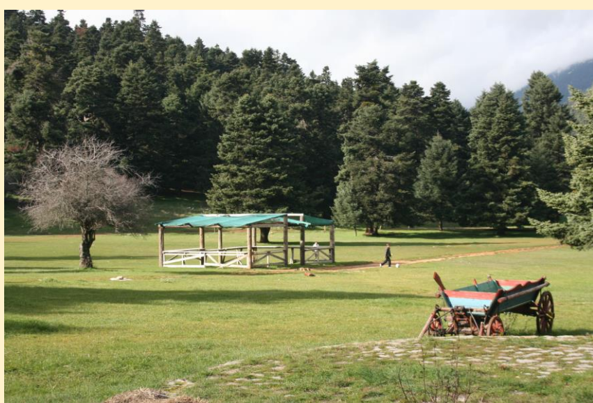
Το οροπέδιο Αρβανίτσας