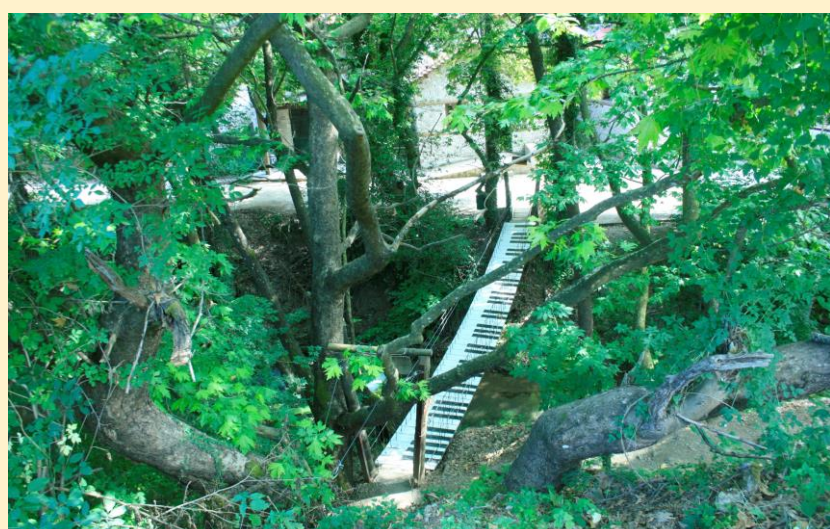
Το πάρκο δραστηριοτήτων στην Παύλιανη